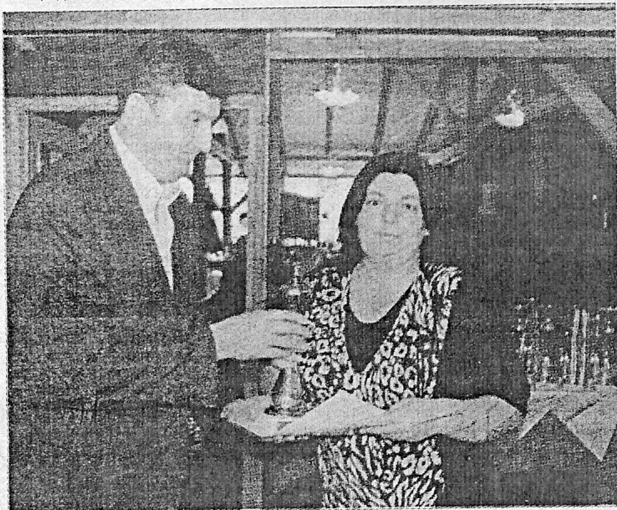
НАЈБОЉА ЖЕНСКА ЕКИПА МИН ХОЛДИНГА: са јучерашњег уручења пехара

управе, док је у пикаду, где није било мушких такмичара, победила екипа ЈКП "Наисус". У одбојци је била најбоље екипа Градске